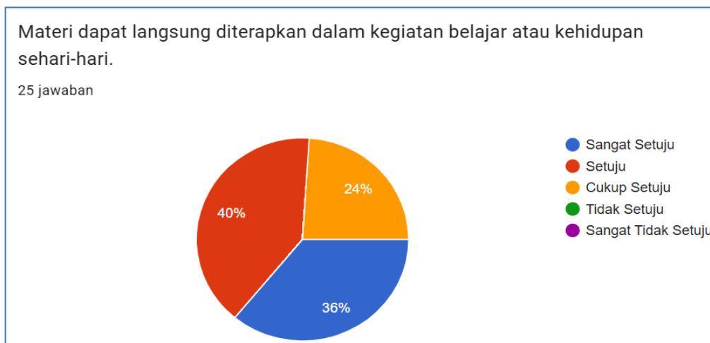
Gambar 6. Materi dapat di terapkan pada proses pembelajaran