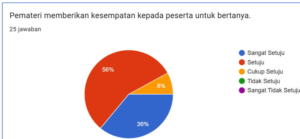
Gambar 5. Tersedianya Sesi Tanya Jawab