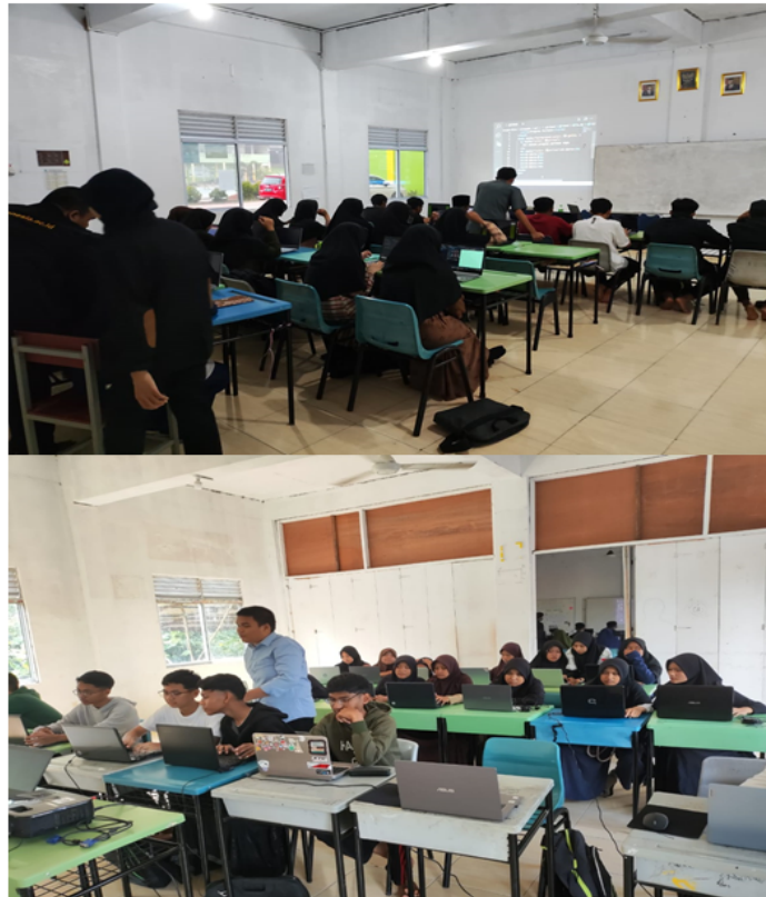
Gambar 2. Pelaksanaan Pelatihan di Pesantren Idris

Hasil evaluasi pelatihan Pelatihan Dasar Pemrograman Web jumlah responden 25 orang adalah sebagai berikut :