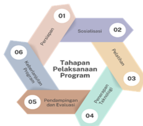
Gambar 1. Tahap Pelaksanaan

Metode yang digunakan terdiri dari tahapan-tahapan sistematis yang disesuaikan dengan permasalahan yang dihadapi oleh mitra, yakni belum pernah diberikan pelatihan dasar pemrograman web. Berikut adalah tahapan pelaksanaan program: